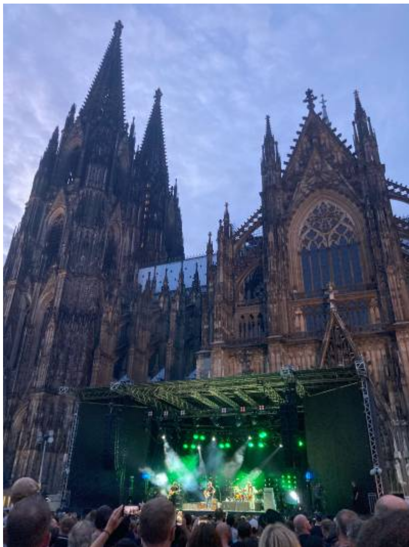
30. Juli 2022, Konzert auf dem Roncalliplatz.