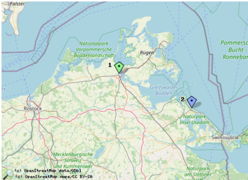
Points of Interest